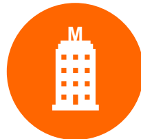
Migros Supermarkt AG