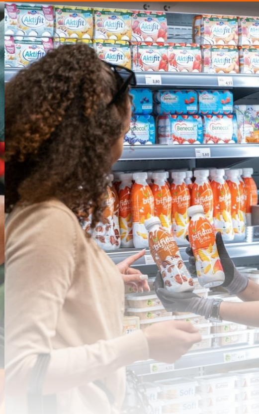
PROXIMITÉ AVEC LA CLIENTÈLE