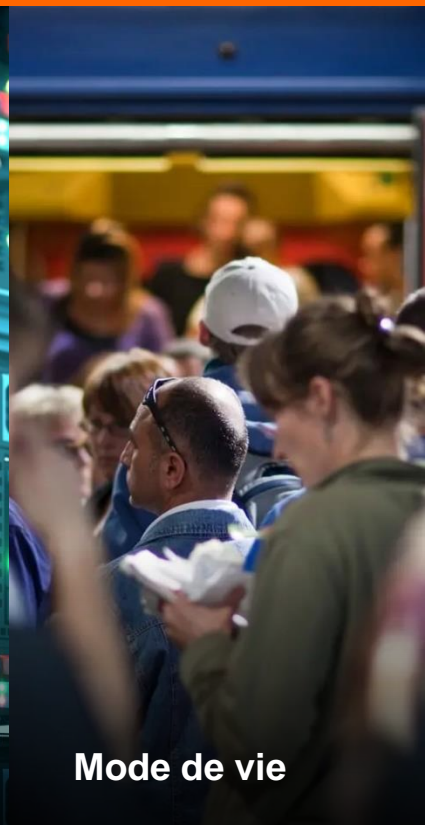
Mode de vie